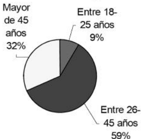
Figura 1: Edad de los Apelantes

De los encuestados, 78 por ciento eran hombres y 22 por ciento mujeres. Cerca de 80 por ciento dijo contar con licenciatura o más grados académicos (45 por ciento de éstos con algún tipo de posgrado). Los resultados probablemente estén determinados por el hecho de que la encuesta estuvo en línea y que todas las personas que la respondieron se sentían, cuando menos, cómodas trabajando en un ambiente electrónico.