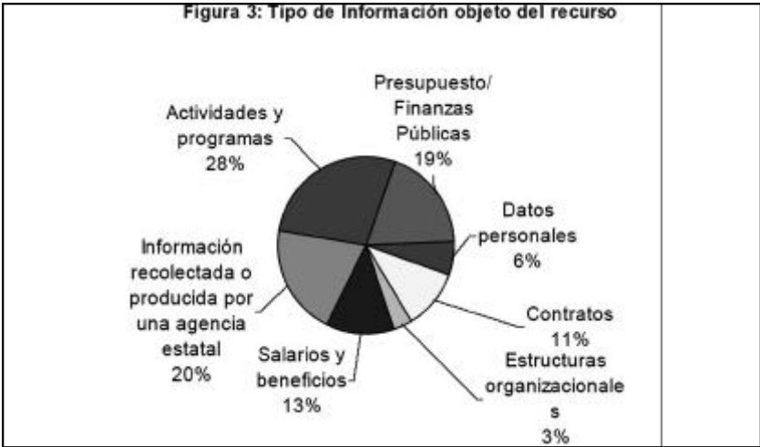
Figura 3: Tipo de Información objeto del recurso

Tal y como se esperaba, dado el lugar en que se encuentran los usuarios finales que presentan solicitudes, 51 por ciento de las apelaciones procede de la ciudad de México y su área conurbana mientras que 43 por ciento procede de otros estados de la República (FIGURA 2: Lugar de Residencia de los Apelantes). El proceso de revisión no parece inhibir más a las personas que no están en la capital, por lo menos en los lugares en con acceso a Internet.